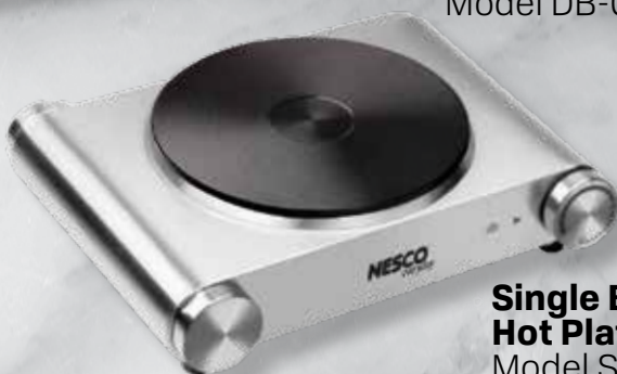
Single Burner Hot Plate Model SB-01