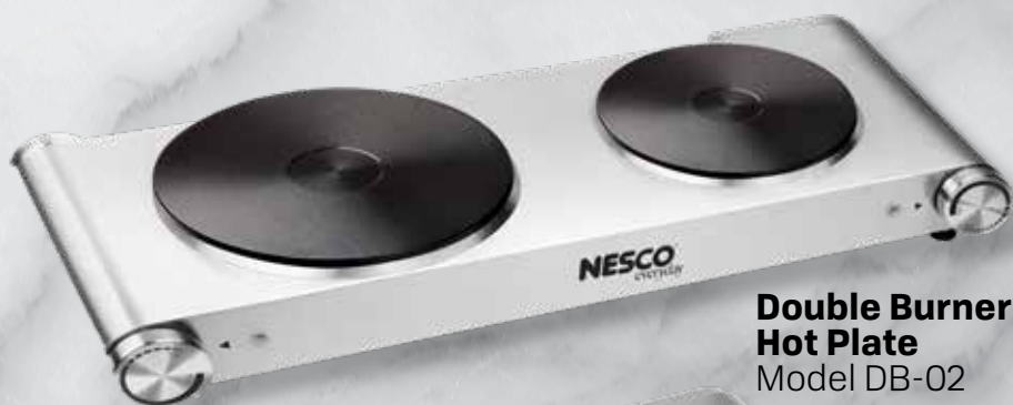
Double Burner Hot Plate Model DB-02